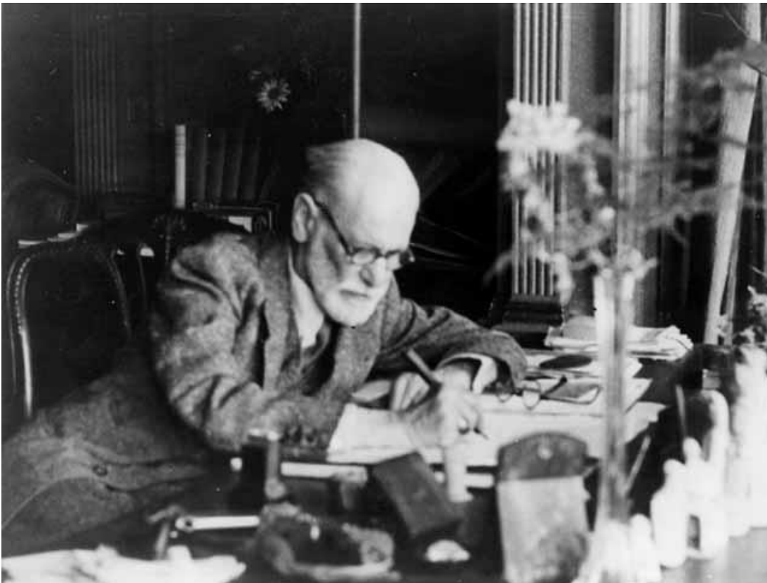
Fig.1- Sigmund Freud.

Enquanto um escolhe palavras para formar sentidos, o outro escuta palavras para incitar a sentidos. Assim, o sujeito que não quer recordar e não quer saber sobre sua neurose, ante o laço de transferência se permite e escreve o seu poema.