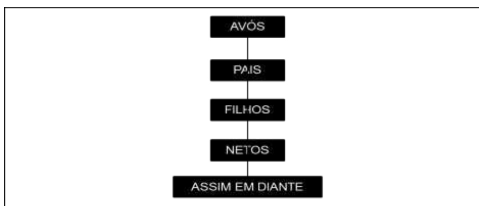
Figura1 - Geração da empresa família

A geração da empresa vai (da mais antiga para o mais nova), não importa se começou da parte da família do pai ou da mãe independente de ambos, sempre é coordenado por um membro da família, é um grande desafio manter a empresa ativa, pois gera muitos fatores que possam impedir o bom desenvolvimento da empresa. Muitas pessoas pensam que só por que é familiar não têm dificuldades e desafios para enfrentar, pelo contrário existem e muitos.