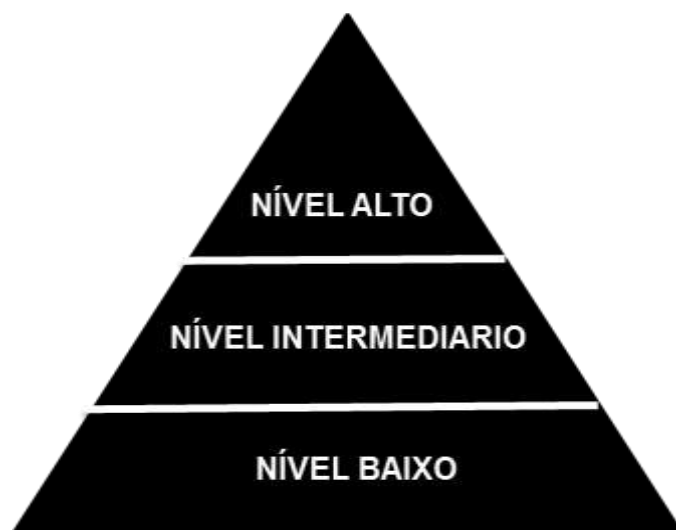
Figura 2 – Nível Hierárquico

Alguns estudos apontam que uma das principais dificuldades das empresas familiares é exatamente o processo de sucessão de poderes, quando é passado de uma geração para outra, esse processo requer muito planejamento e deve ser inicializado com bastante antecedência ao dia que de fato a próxima geração irá assumir o controle da empresa.